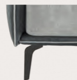
Piede in metallo Trim finitura manganese, optional / Trim feet in metal finish optional manganese finish