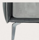
Piede in metallo Trim finitura cromo, optional Trim feet in metal finish optional chrome finish