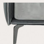
Piede in metallo Trim finitura grigio, di serie Trim feet in grey metal finish as standard